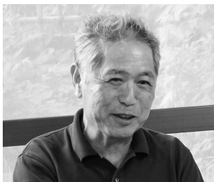
山本省三（やまもと・しょうぞう）

1952年神奈川県生まれ。絵本・童話作家。文と挿絵の両方を手掛け、絵本からノンフィクションまで執筆。著書に、『動物ふしぎ発見』シリーズ、『キセキのスバゲッティー』、『暗号サバイバル学園』シリーズなど。2019年より日本児童文芸家協会理事長。